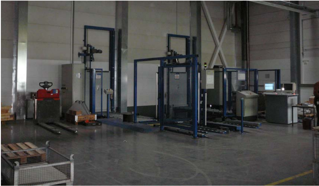
Ansicht Belade- und Entladestation