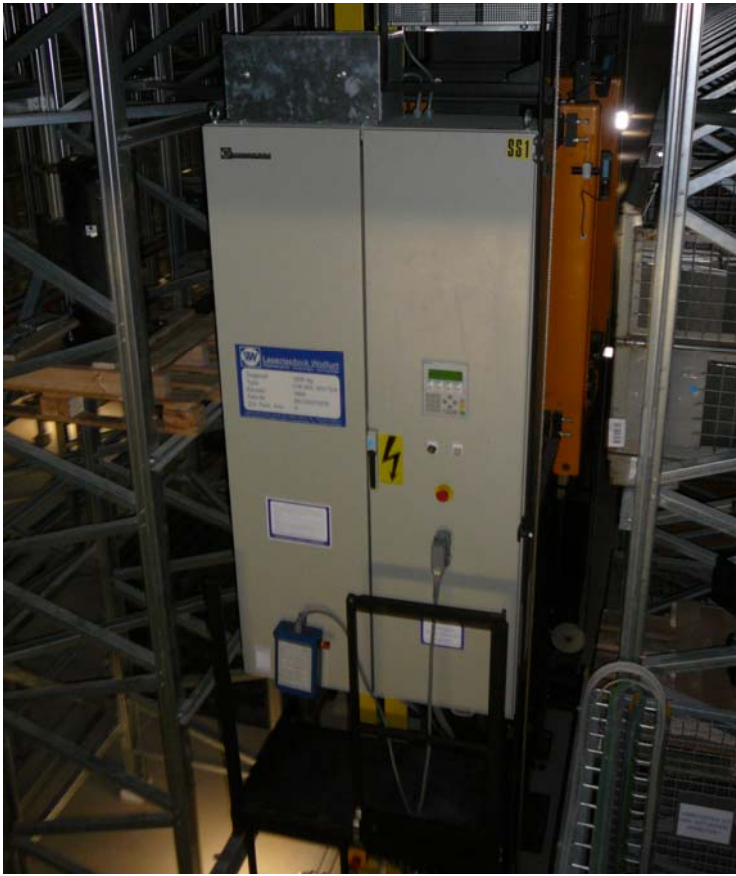
Fahrgerät im Lager