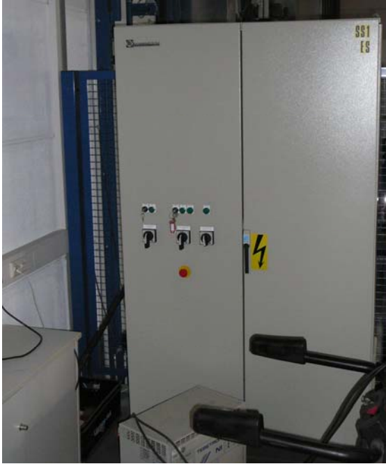
Elektroverteilung und Steuerung